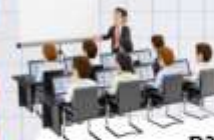
การบรรยาย