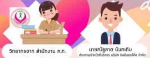
วิทยากรจาก สำนักงาน ก.น.