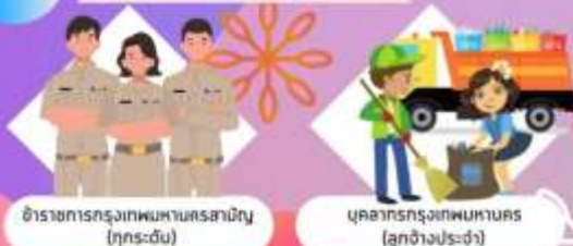
ข้าราชการกรุงเทพมหานครสามัญ (ทุกระดับ)