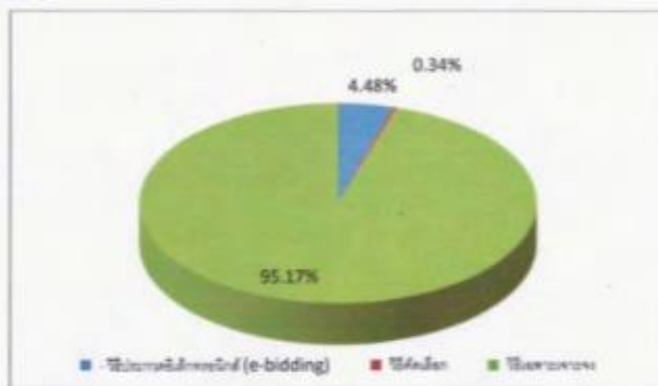
ภาพที่ 1 ร้อยละของวิธีการจัดซื้อจัดจ้างพัสดุ ประจำปีงบประมาณ พ.ศ. 2564

จากตารางที่ 1 ในปีงบประมาณ พ.ศ. 2564 สำนักงานเขตบางกอกใหญ่ได้ดำเนินการจัดซื้อจัดจ้างเป็นจำนวน 252 รายการ พบว่าวิธีการจัดซื้อจัดจ้างที่มีจำนวนโครงการมากที่สุด คือ วิธีเฉพาะเจาะจง จำนวน 276 โครงการ คิดเป็นร้อยละ 95.17 รองลงมา คือ วิธีประกวดอิเล็กทรอนิกส์ (e-bidding) จำนวน 13 โครงการ คิดเป็นร้อยละ 4.48 และน้อยที่สุด คือ วิธีคัดเลือก จำนวน 1 โครงการ คิดเป็นร้อยละ 0.34 ตามลำดับ ดังภาพที่ 1